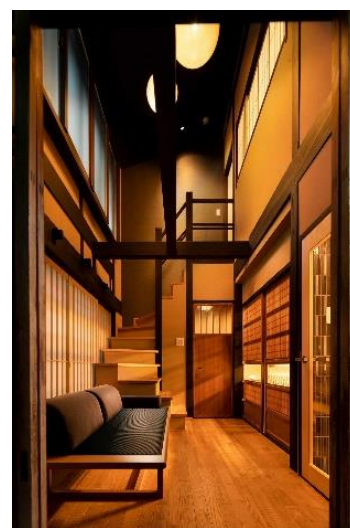
一日一組限定一棟貸し 「紡 Machiya Inn」

ホームページ https://re-connection.co.jp/ 自社ブランド 紡 Machiya Inn https://tsumugi-kyoto.jp/ 紡 Dining https://dining.tsumugi-kyoto.jp/ 紡 cafe https://www.instagram.com/tsumugicafe_kyoto/