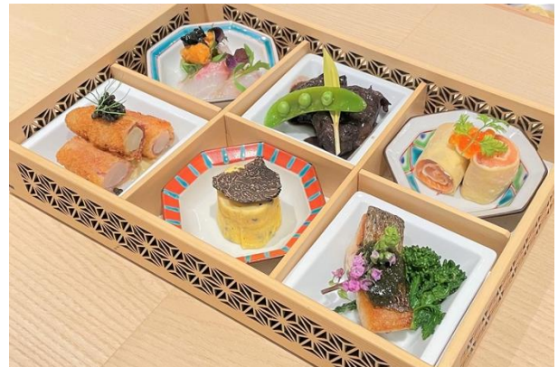
京都肉など贅沢な素材を使用した「紡 Dining」謹製のお弁当