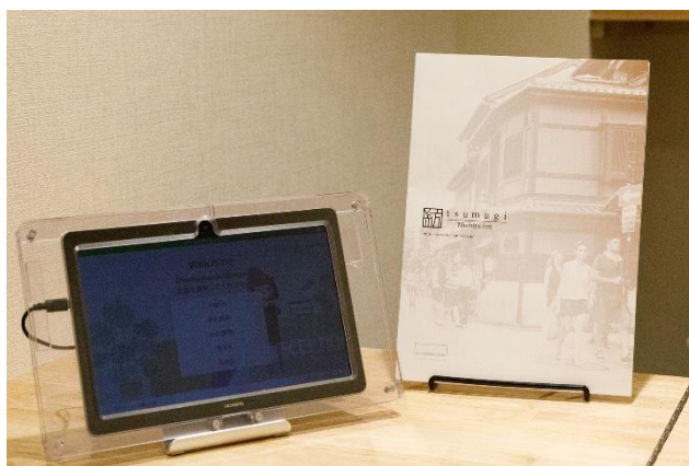
施設外玄関帳場部分では宿泊客のチェックイン業務を行う