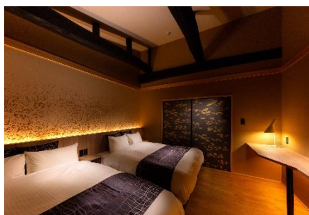
年代物の梁はあえてそのままに