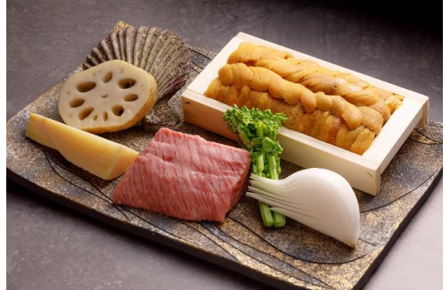
京都肉をメインに、旬の素材を月替わりのコースでご提供