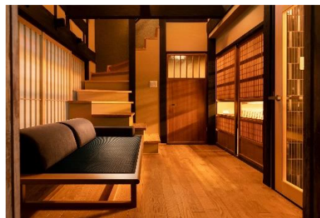
床暖房を配するなど、快適性にもこだわる