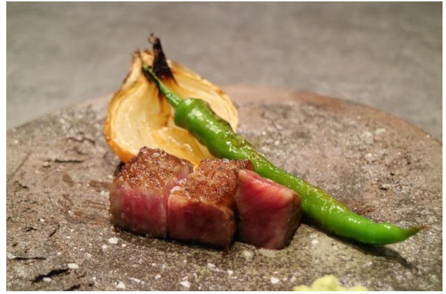
京都肉のサーロインステーキ