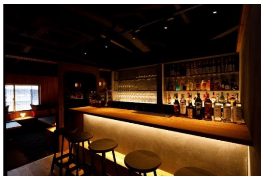
上質な内装と照明にこだわった2F