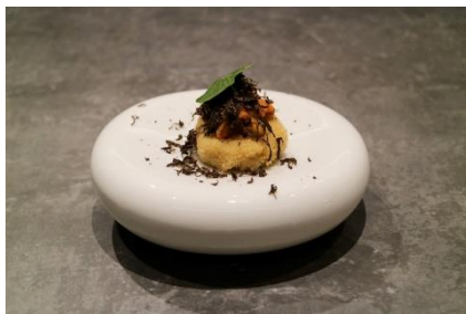
卵の花と海老いものコロッケ