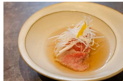
京都肉と九条ネギの肉吸い