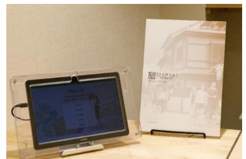
施設外玄関帳場部分では 宿泊客のチェックイン業務を行う

（注1）施設外玄関帳場…京都では条例の改正に伴い、簡易宿所を営業する際には宿泊施設内または施設外に帳場（フロント）を設けることが必要になります。既存施設については2020年3月末まで経過措置がありますが、2020年4月1日からは条例に基づいた運営が義務となるため、今後施設外玄関帳場の重要性はますます高いものとなります。