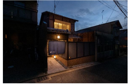
大通りから一筋入る閑静な立地環境

施設名： 紡 稲荷庵 (つむぎ いなりあん) オープン日： 2020年2月15日 住所： 京都市伏見区深草上横縄町 17-13 アクセス： 京阪本線「伏見稲荷」駅より徒歩約4分 JR 奈良線「稲荷」駅より徒歩約8分 施設概要： 延床面積 60.70㎡ 定員： 最大5名 料金： 一泊3万円前後を予定 特徴： 国内外からの観光客で連日にぎわいをみせる伏見稲荷大社に程近い場所に位置し、観光に最適な立地です。大通りの喧騒を感じさせない、穏やかな時間の流れる路地奥の京町家となっています。 前庭と奥庭を配したことで双方から光と風が入り、移り変わる京都の四季を感じることができます。機能性、デザイン性に配慮した家具や備品でお客さまの快適な滞在を実現します。古き良き趣を残し、歴史や文化に触れることができる空間へと改装いたしました。