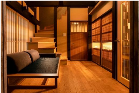
床暖房を設置するなど 趣は残しつつも快適な空間に