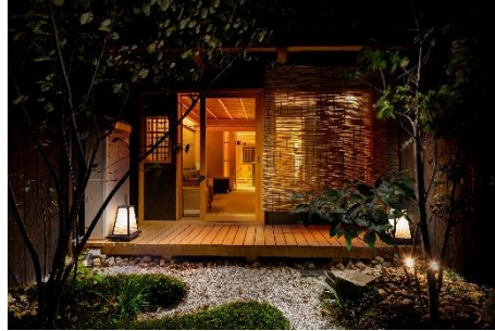
非日常な京町家ステイを体験できる