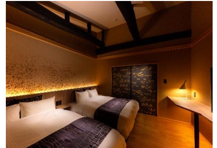
年代物の梁はあえて見せる工夫