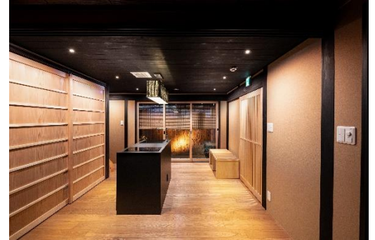
アイランドキッチンと広い縁側が特徴

施設名： 紡 八条源町(つむぎ はちじょうみなもとちょう) オープン日： 2020年2月15日 住所： 京都市南区八条源町 115 アクセス： 近鉄京都線「東寺」駅 徒歩約15分 各線「京都」駅 徒歩約20分 京都市バス16号系統「御土居」停留所徒歩約1分 施設概要： 延床面積 90.89㎡ 定員： 最大9名 料金： 一泊5万円前後を予定 特徴： 築83年の歴史を持つ京町家を改装した最大9名までお泊りいただける一棟貸しの宿泊施設です。築年数を重ねているものの比較的に良好な状態が保たれていた物件を約4カ月かけて改装し、正面から奥まで抜けるトオリニワや吹き抜け空間である火袋、おくどさんなど現況の趣を随所に残しつつ、ゆったりとお過ごしいただける空間に仕上げています。 京町家の一つの大きな特徴である「うなぎの寝床」と呼ばれる、間口は狭く奥に長い独特の形状を保っています。独立した3部屋の寝室を備えており、大人数でのご宿泊も快適にお過ごしいただけます。