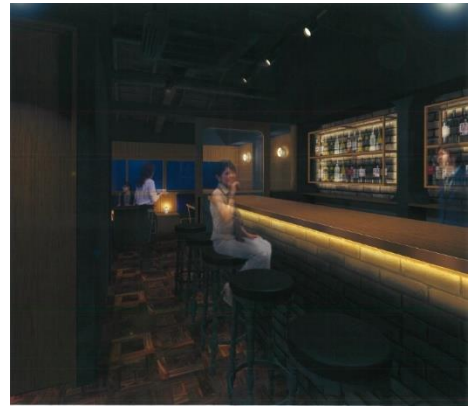
落ち着いた雰囲気を出す2階BARスペース