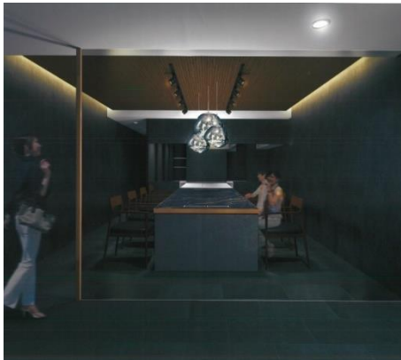
キッチンとの一体感を演出する大テーブル