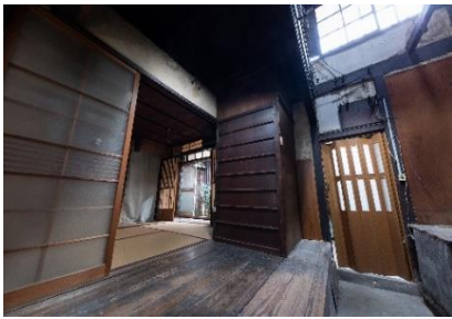
町家の趣は残して改装を行う

当社は多くの歴史的文化的価値を持つ「京町家」を次の世代に受け継ぐべきものであると考え、外観や内観の趣や意匠をできるだけ残し、一日一組限定の一棟貸し宿泊施設として再生する取り組みを行っております。デザインや施工、運営管理、清掃まで一貫してトータルサポート出来ることが当社の強みであり、宿泊していただくゲストには京町家に泊まるという特別な体験を、そして地域社会には街の再生や活性化という形で貢献していきたいと考えています。時代の流れに沿った整備を行い、人の流れを生むことで街は街として息づきます。わたしたちは受け継がれてきた歴史や文化を次の世代に紡ぐ担い手になりたいと考えています。