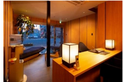
ゲストをお迎える専用レセプション