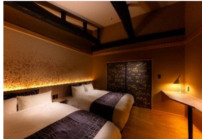
丈夫な梁は残して活かす施設作り