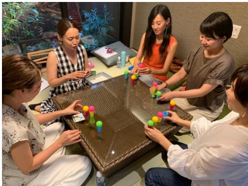
アナログゲームの講座風景

地域交流の一環として、「紡 七条堀川」「紡 河原町二条」において下記のとおりイベントを開催しました。