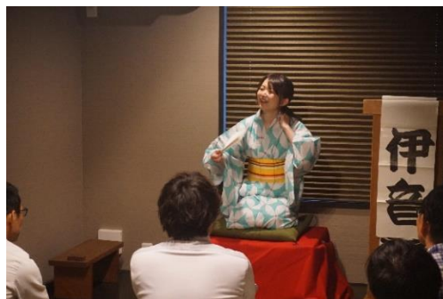
一服の笑いで繋がる

ご参加いただいた近隣住民の方からは「夏らしい演目で楽しめた」 「工事中からどんな出来上がりになるのか興味を持っていた。町家 らしい雰囲気うまく作ってあり驚いた」などの感想をいただきました。