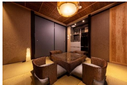
つむぎ しちじょうほりかわ 9/14 オープン「紡 七条堀川」