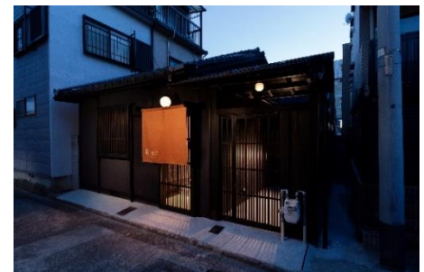
平屋造りの趣ある外観