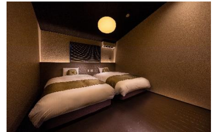
高い天井と柔らかいフォルムを持つ間接照明で癒しのひとときを