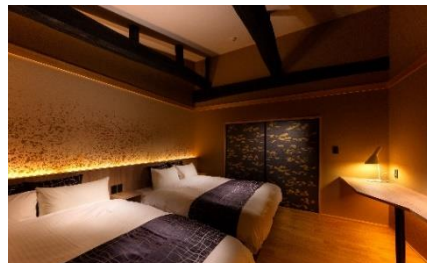
丈夫な梁は残して活かす施設作り