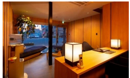
京都駅前の専用レセプション