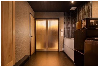
つむぎ かわらまちにじょう 8/17 オープン「紡 河原町二条」