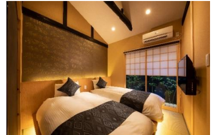
つむぎ きょうとえきみなみ 9/22 オープン「紡 京都駅南」