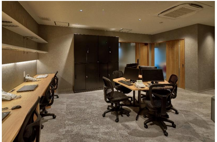
2020年7月に移転した京都駅前新オフィス

当社は2016年4月の起業時より「人を結び 街を紡ぐ」をコンセプトに、京町家の保存と再生・活用を通じて京都の未来を紡ぐ担い手となることを目指し、事業に取り組んでいます。多くの文化的価値を持つ「京町家」を次の世代に受け継ぐべきものであると考え、外観や内観の趣や意匠をできるだけ残し、一日一組限定の一棟貸し宿泊施設として再生する取り組みを行っております。(現在京都市内で51棟を管理運営) デザインや施工、運営管理、清掃まで一貫してトータルサポート出来ることが当社の強みであり、宿泊していただくゲストには「京町家に泊まる」という特別な体験を、そして地域社会には「街の再生や活性化」という形で貢献していきたいと考えています。