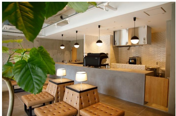
日当たりのいい開放感溢れる店内